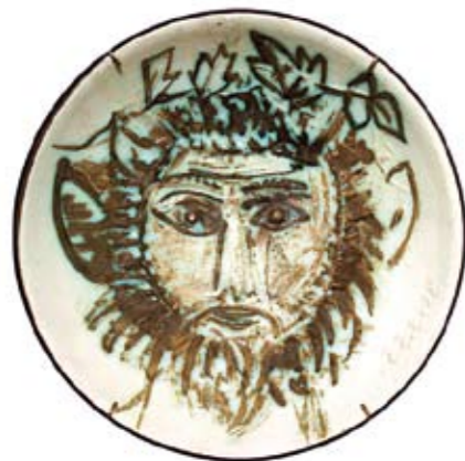
▲ Ceramica in maiolica smaltata e dipinta: testa di fauno 1954-1955 Collezione Dominguin-Bosè.