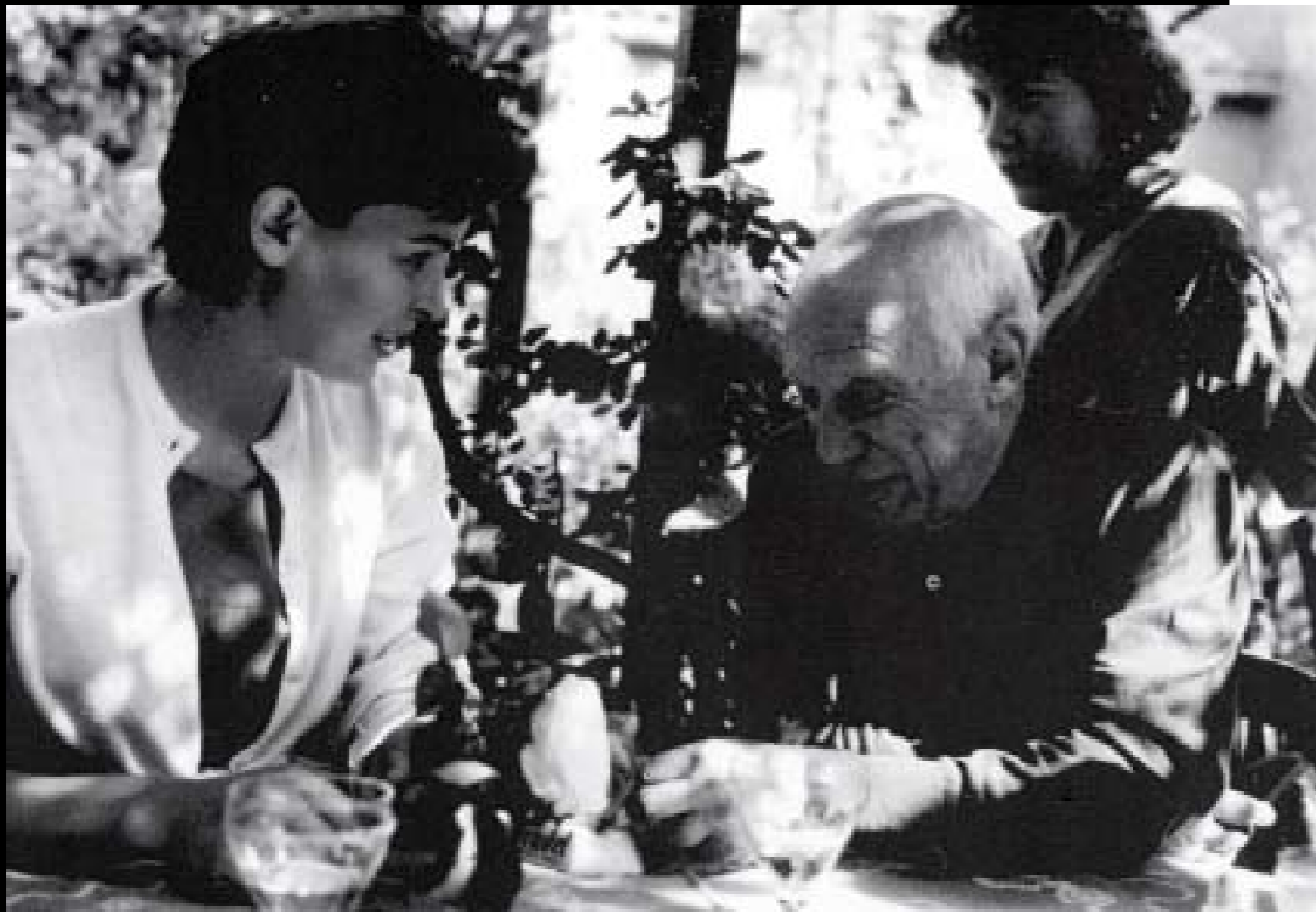
Picasso e Lucia Bosè in giardino.

a progetti insoliti (disegni per bambini, bambole, tori con le ali...) e hanno creato uno spettacolo affascinante di nuova concezione per tutti gli spiriti curiosi. Dissolvenze sonore e vivive per comunicare la fusione delle arti non dimenticando la grande eredità di Picasso che collaborava con Cocteau, Satie... i geni del suo tempo ed interagiva con loro.