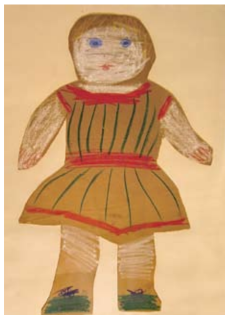
Pablo Picasso, Toro con cuatro orejas Carboncino e matita 21 x 27 cm 1962 Collezione Dominguin-Bosè.