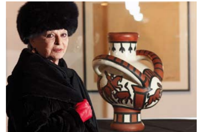
Lucia Bosè. A fianco anfora con scene taurine.

Lucia Bosè ha partecipato in prima persona alla "costruzione" delle audio-guide che, tramite la sua voce accompagnano il fruitore attraverso un'esperienza unica qual'è stata l'amicizia tra questi tre protagonisti del '900. A tutti viene data la possibilità unica di vivere l'atmosfera particolare di casa Dominguin e l'interazione tra personaggi straordinari attraverso le parole della "padrona di casa". "Sono convinta, afferma Serena Baccaglini, che proprio gli aneddoti che